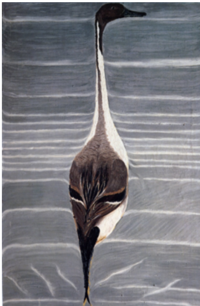
Г. Райшев. Острохвост. 1976 Gennady Rayshev. Pintail. 1976

Провидческие картины Райшева — словно свидетельства возможностей грядущих изменений, которые реально заложены в геокультурном пространстве Родины. Поставленные рядом, они становятся наглядным визуально-образным воплощением ситуации выбора одного из путей развития, неумолимо встающим перед Россией и всем человечеством XXI в.: или опустить себя в сиротски-планетарное никуда; или, всеми силами выбираясь из засасывающей «застольщины», устремиться к созвучию с ритмами Благодатного Света.