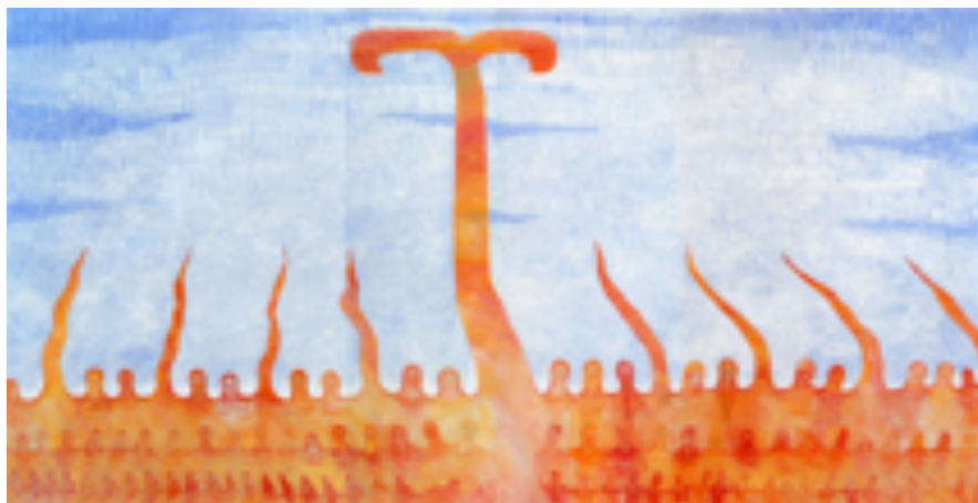
Г. Райшев. Российская песня. Цикл «Российские песни». 1992 Gennady Rayshev. Russian song. "Russian songs" Cycle. 1992