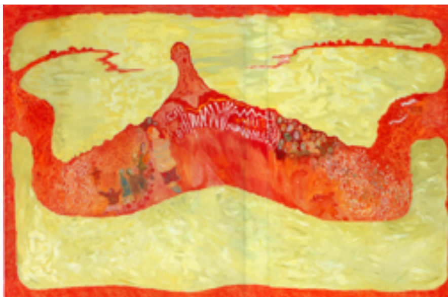
Г. Райшев. Красная гармонь. Цикл «Российские песни». 1993 Gennady Rayshev. Red Accordion. "Russian songs" Cycle. 1993

Фон — остальное огромное пространство во всех работах серии, заполнен тщательно и сложно прописанной вибрацией массы белого, массы «воздуха», «облаков», туманов. Здесь отчетливо звучат отблески цвета утренней зари, окрасившей и столп/ колонну/дерево, и фигуры людей.