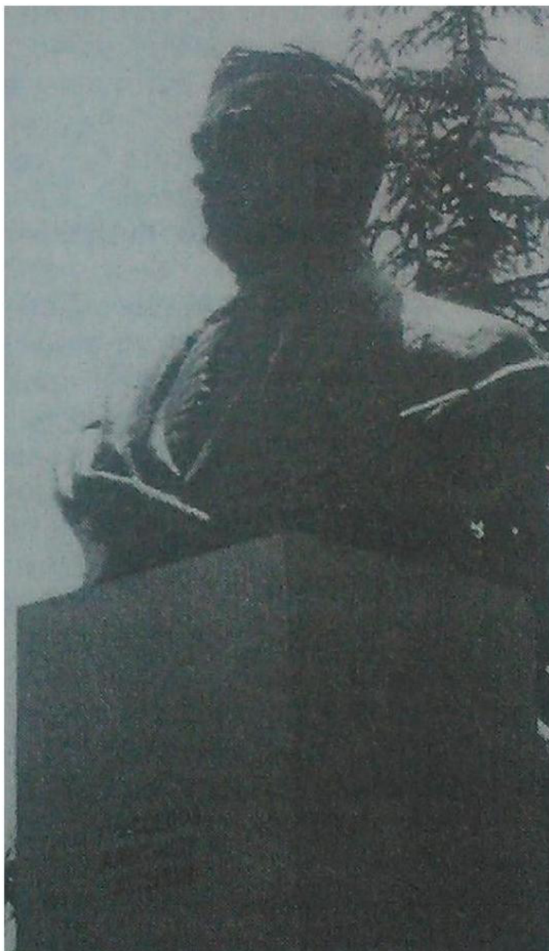
Рисунок 1 – Почти сразу после открытия памятника А. С. Грибоедову в г. Алушта его фотографию напечатала «Крымская газета». Figure 1 – Photo of the monument to A. S. Griboyedov by the “Crimean Newspaper” almost right after its opening in Alushta.

Illustrations to the article of S. S. Minchik “On the only monument to A. S. Griboyedov in Crimea”