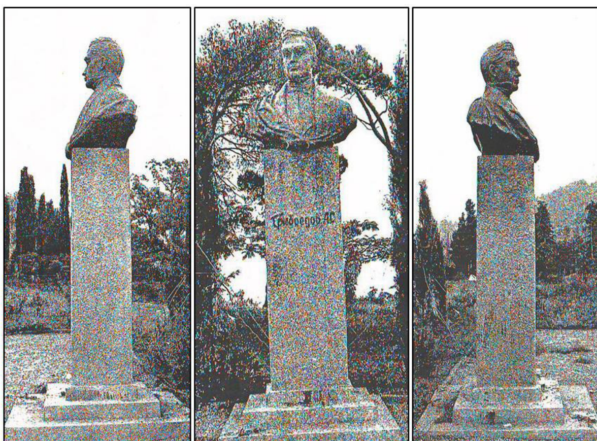
Рисунок 3 – Фотографий памятника А. С. Грибоедову в приложениях к «Паспорту» объекта сразу несколько. Figure 3 – The “Passport” of the object contains at once several photos of A. S. Griboyedov’s monument.