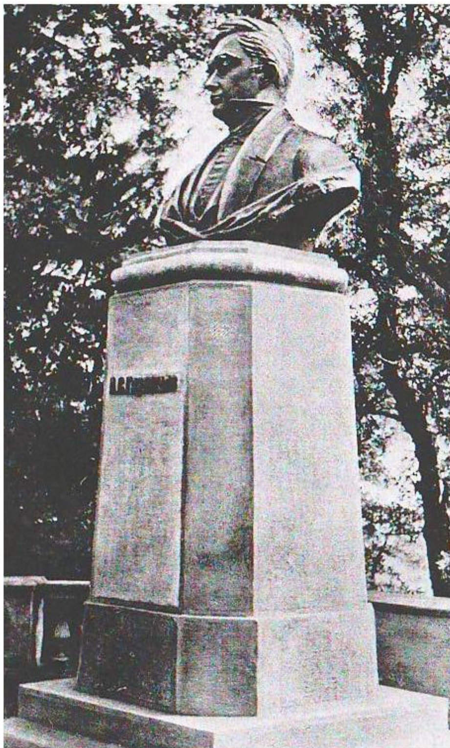
Рисунок 4 – На почтовых открытках изображение памятника А. С. Грибоедову в г. Ялта появилось спустя четыре года после его установки.

Figure 4 – The postcards' image of the monument to A. S. Griboyedov in Yalta appeared four years after its installation.