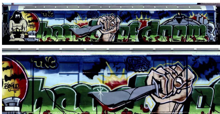
Иллюстрация 1 – Работа граффити-райтера Seen’a — “Hand of Doom”, 1980 г., Бронкс, Нью-Йорк, США