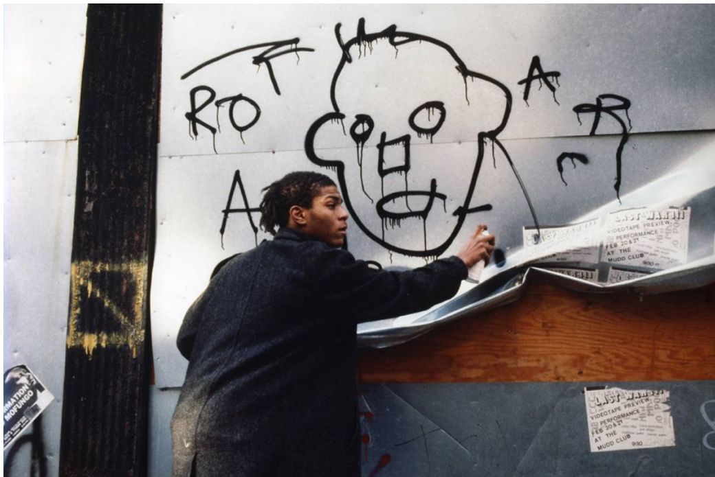
Иллюстрация 2 – Ж. М. Баскиа в процессе создания авторского граффити Figure 2 – J. M. Basquiat in the process of creating the author's graffiti

Культовые персонажи раннего стрит-арта, такие как Ж. М. Баскиа и К. Харинг, заявили о себе на художественной сцене Нью-Йорка в галереях района Ист-Виллидж в 1982–1983 гг. Баскиа начал рисовать граффити на стенах зданий в Манхеттене еще в 1977 г. Сначала изображения состояли из ироничных фраз без каких-либо сюжетных элементов, а в период с 1980 по 1982 г. он часто рисовал скелеты и маски, затем другие фигуративные образы: автомобили, здания, полицейских, игры детей на тротуаре, стилизованные под гаитянскую пластику фигуры. Его произведения имели ясно считываемый сюжет и являлись сюжетными композициями, при этом роль всегда присутствовавшего в них экспрессивного граффити-шрифта оставалась неизменно высокой (ил. 2).