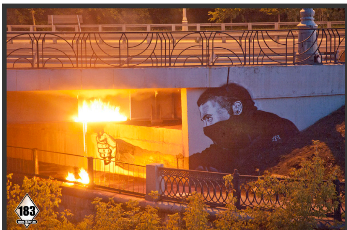
Иллюстрация 8 – Работа стрит-арт художника Павла 183 «Поджигателям мостов. Посвящение», Москва, 2011 г. Figure 8 – The work of street art artist Pavel 183 “To the arsonists of bridges. Dedication”, Moscow, 2011

получивший прозвище «русский Бэнкси» в начале 2000-х гг. рисовал различных персонажей в реалистичной и стилизованной манерах. Он создавал сюжетные стрит-арт композиции, как правило, состоящие из комбинации — ключевого персонажа (действия) и фона, детально проработанного или заменяемого фактурой внешней среды, которая активно задействуется в композиции. Сюжетная композиция Павла 183 — “Fight for not cash” («Сражайся не за деньги») иллюстрирует первый и третий метод создания сюжетных композиций в стрит-арте — дословное воспроизведение первоисточника, а также метод коллажа и микширования. Данная работа — яркий пример того, каким образом из различных элементов комбинировалась сюжетная стрит-арт композиция в конце 2000-х — в ее основе реалистические фотоизображения, стилизованные под плакатный портрет. Фотореалистичная монохромная композиция с портретом Виктора Цоя на переднем плане, с граффити-художниками в момент их работы на втором плане, дополняется ярким контрастным шрифтом (ил. 7).