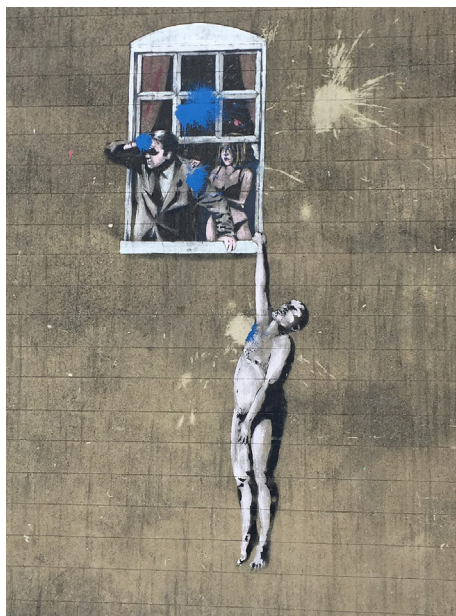
Иллюстрация 5 – Работа стрит-арт художника Бэнкси “Good Hanged Lover”, Бристоль, 2006 г. Figure 5 – The work of the street art artist Banksy “Good Hanged Lover”, Bristol, 2006

Как и многие из популярных работ Бэнкси, другая его композиция «Хорошо висящий любовник» 2006 г., — тоже сюжетная (ил. 5). На стене клиники сексуального здоровья в английском городе Бристоль изображена комичная сцена с обнаженным мужчиной (застигнутым врасплох любовником), свисающим из окна. Эта работа быстро стала известной, и после решения городского совета Бристоля данная работа стала первым легальным произведением уличного искусства в Великобритании, которая попала под непосредственную защиту государства.