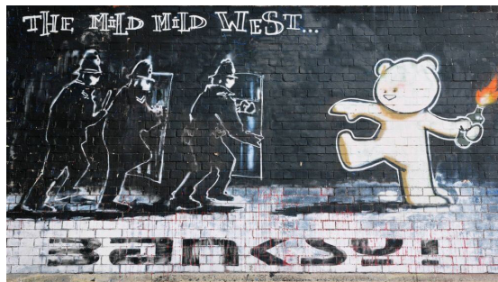
Иллюстрация 4 – Работа стрит-арт художника Бэнкси “The Mild Mild West”, Бристоль, 1999 г. Figure 4 – The work of the street art artist Banksy “The Mild Mild West”, Bristol, 1999

“The Mild Mild West” 1999 г. — одна из первых известных широкой публике работ Бэнкси, расположена в английском городе Бристоль (ил. 4). Сюжетная композиция, где изображен плюшевый мишка, бросающий коктейль Молотова в трех спецназовцев, была нарисована в центре города в ответ на агрессивное вмешательство полиции в дела сообществ молодежи. Данная работа ознаменовала переход Бэнкси от классического шрифтового граффити к сюжетному стрит-арту, который и принес ему международную известность.