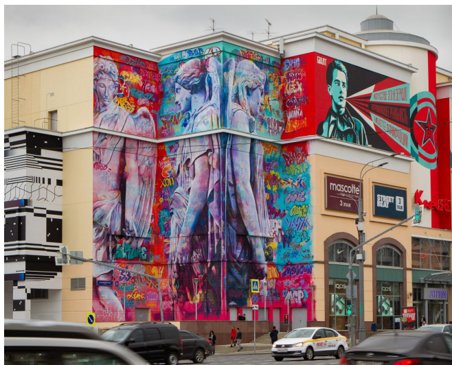
Иллюстрация 12 – ТЦ «Атриум», Москва, 2019 г. Figure 12 – Atrium Shopping Center, Moscow, 2019