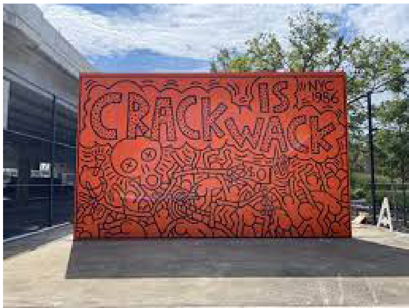
Иллюстрация 3 – Работа художника К. Харинга “Crack is Wack”, 1986 г., Нью-Йорк Figure 3 – The work of the artist K. Haring “Crack is Wack”, 1986, New York

Кит Харинг, один из основоположников сюжетного стрит-арта, стал известен благодаря легко узнаваемым коллажам и граффити-зарисовкам в городском метро Нью-Йорка. Он разработал авторский стиль графического «автоматического письма», для которого характерны стилизованные схематичные персонажи, сгруппированные вокруг граффити-слоганов, действующие в рамках сюжетных историй и коллизий (ил. 3). Иногда это плакаты, рисунки маркером и аэрозольным баллоном с краской, переделанные рекламные билборды. Для К. Харинга было характерно масштабное мышление: он тяготел к репрезентативности, быстро покрывал авторскими знаками и символами все поверхности; его сюжетным композициям была присуща экспрессия и декоративность.