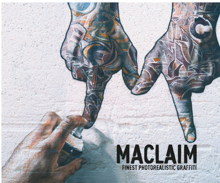
Иллюстрация 6 – Работа стрит-арт коллектива Ma Claim, Франкфурт, 2006 г. Figure 6 – The work of the street art collective Ma Claim, Frankfurt, 2006

К 2000-м гг., за счет внедрения и распространения новых технологий, технические возможности стрит-арта возрастают, что, как следствие, делает возможным повышение уровня реалистичности сюжетных композиций. Художественный профессионализм и качество исполнения сюжетного стрит-арта в целом возрастают. Теперь стрит-арт — это не только производная хип-хоп субкультуры или граффити — это способ самовыражения на улице посредством интеллектуального диалога. От работ с низким коммуникативным потенциалом все чаще прослеживается тенденция к появлению работ, затрагивающих актуальную проблематику [7]. В 2000-х гг. на стенах городов было создано немало монохромных (в духе фотореализма) изображений культовых личностей — политиков, музыкальных исполнителей, спортсменов и т. д. Такие стрит-арт команды, как Ма Клайм (“Ma Claim”) задают тренд на сюжетный фотореализм в стрит-арте в начале 2000-х, параллельно с этим процессом происходит сближение стрит-арта с актуальным искусством, обогащение его техник художественными практиками инсталляции и перформанса [3].