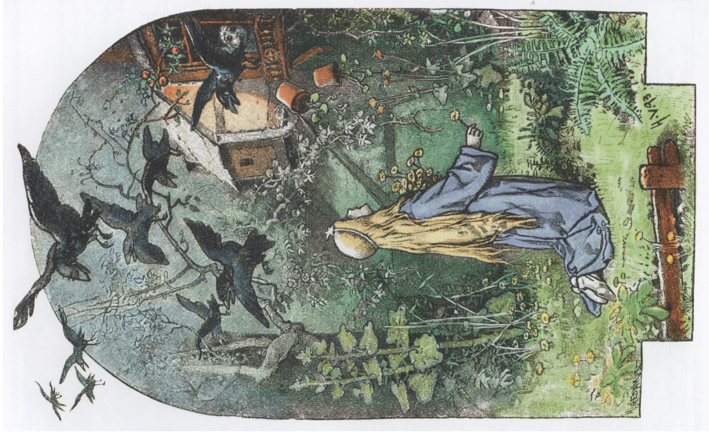
«Двенадцать братьев», две иллюстрации Г. Фогеля. 1892–1893 “The Twelve Brothers”, two illustrations by G. Vogel. 1892–1893

ein wenig am Fuß, so daß es hinten mußte und langsam fortließ. Da schlich ihm ein Jäger nach bis zu dem Häu- sen und hörte, wie es rief: „Mein Schwefstein, laß mich herein!“ und sah, daß die Tür ihm aufgetan und alsbald wieder zuge- schlossen ward. Der Jäger behielt das alles wohl im Sinn, ging zum König und erzählte ihm, was er gesehen und gehört hatte. Da sprach der König: „Morgen soll noch einmal gejagt werden.“