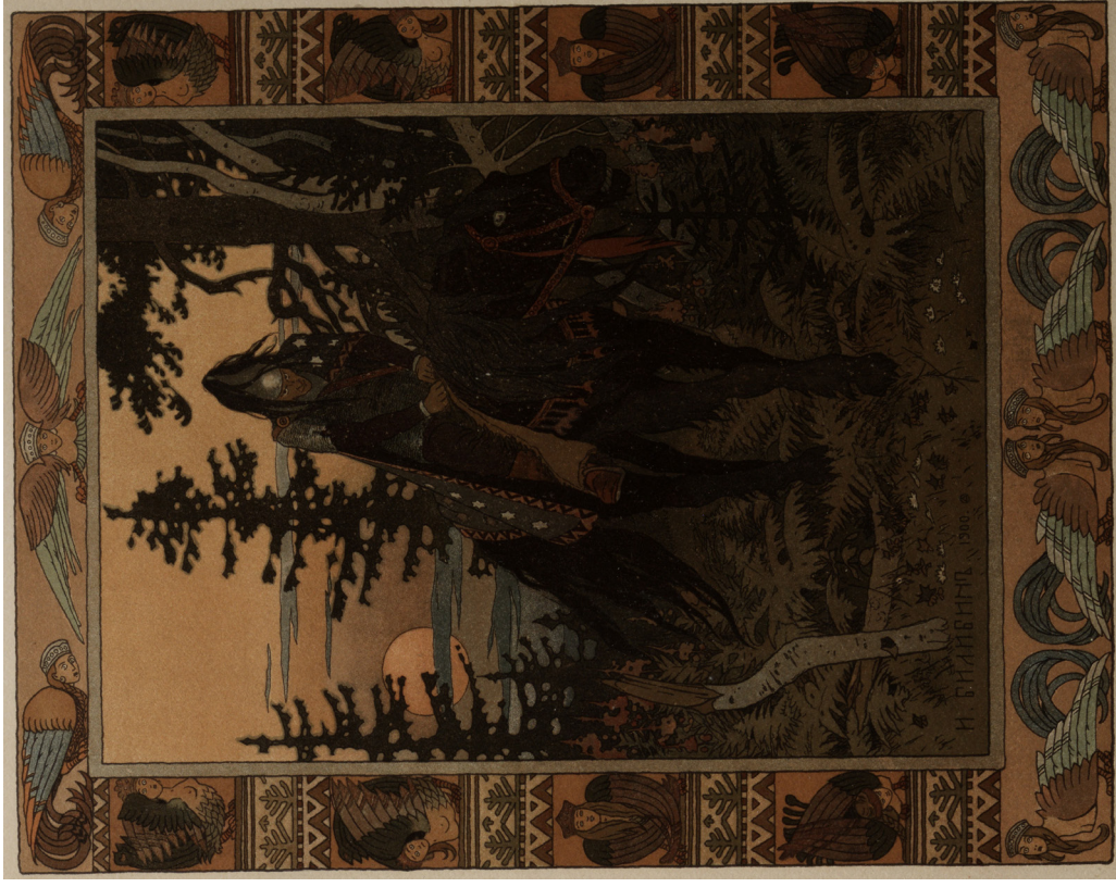
Иллюстрация И. Билибина к сказке «Василиса Прекрасная», 1902 Illustration by I. Bilibin for the fairy tale "Vasilisa the Beautiful". 1902