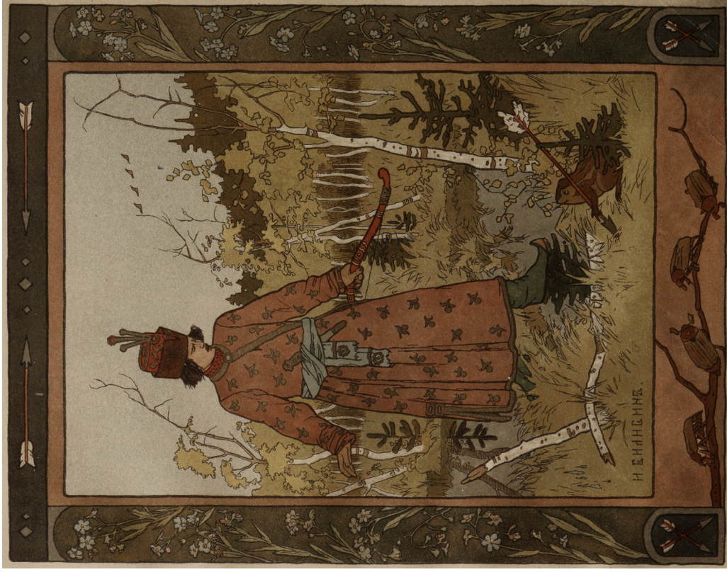
Иллюстрация И. Билибина к сказке «Царевна-лягушка», 1901 Illustration by I. Bilibin for the fairy tale "The Frog-Princess". 1901