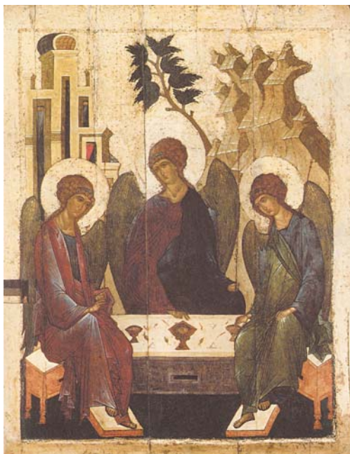
Рис. 1. Пресвятая Троица. Средняя Русь. Середина XVI в. Из Троицкой церкви с. Дивная Гора близ Углича. ЦМиАР