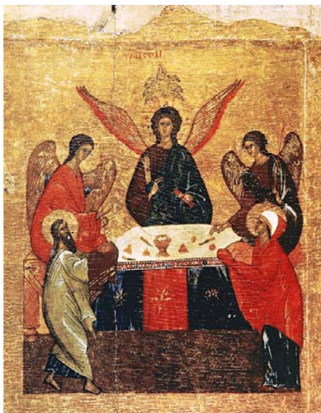
Рис. 3. Деталь четырёхчастной иконы. Новгород, начало XV в. Государственный Русский музей