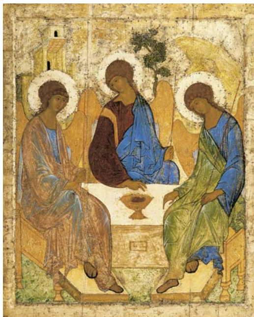
Рис. 2. Пресвятая Троица. прип. Андрей Рублёв. XV в. ГТГ