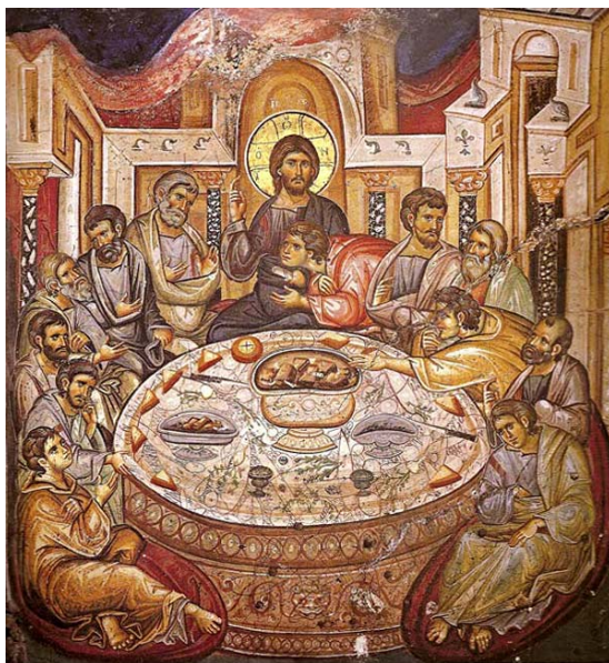
Рис. 4. Фреска Кафоликона Ватопедского монастыря. Афон. 1312 г.