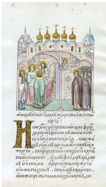
Видение ангела, сослужащего преп. Сергию Радонежскому. Миниатюра из лицевого Жития преп. Сергия Радонежского. РГБ, ф. 304.III, № 21 (М. 8663), л. 235 об. Около 1592 г.