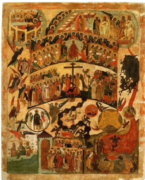
Рисунок 4 — Икона «Страшный Суд», сер. XVI в. из собрания Ярославского художественного музея (Инв.И-13, КП 53403/13)

Figure 4 — Icon “The Last Judgment”, Mid-16 th Century, from the Collection of the Yaroslavl Art Museum (Inv.I-13, KP 53403/13)