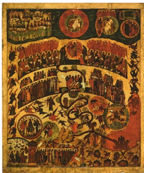
Рисунок 6 — Икона «Страшный Суд», вт. пол. XVI в., новгородская школа из собрания Государственной Третьяковской Галереи (Инв.14458)

Figure 5 — Icon “The Last Judgment”, from the State Hermitage Museum, Late 15 th Century (Inv. ERI-230, Received from the Church of the Intercession of the Virgin Mary, Lyadiny Pogost)