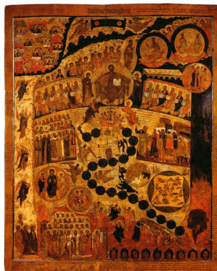
Иллюстрация 2 — «Строгановская» икона «Страшный Суд», нач. XVII в. (Инв. И-117 из Пермской галереи) Figure 2 — The Stroganov icon “The Last Judgment”, Early 17 th Century (Inv. I-117 from the Perm Gallery)