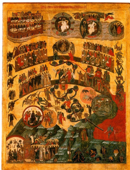
Иллюстрация 1 — «Строгановская» икона «Страшный Суд», кон. XVI в. (Инв. SM-347-Ж из Сольвычегодского музея) Figure 1 — The Stroganov icon “The Last Judgment”, Late 16 th Century (Inv. SM-347-Zh from the Solvychevodsk Museum)