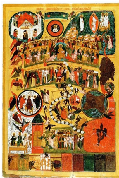
Рисунок 5 — Икона «Страшный Суд», из Государственного Эрмитажа, посл. чет XV в. (Инв. ЭРИ-230, поступила из Покровской церкви погоста Лядины)

Figure 4 — Icon “The Last Judgment”, Mid-16 th Century, from the Collection of the Yaroslavl Art Museum (Inv.I-13, KP 53403/13)