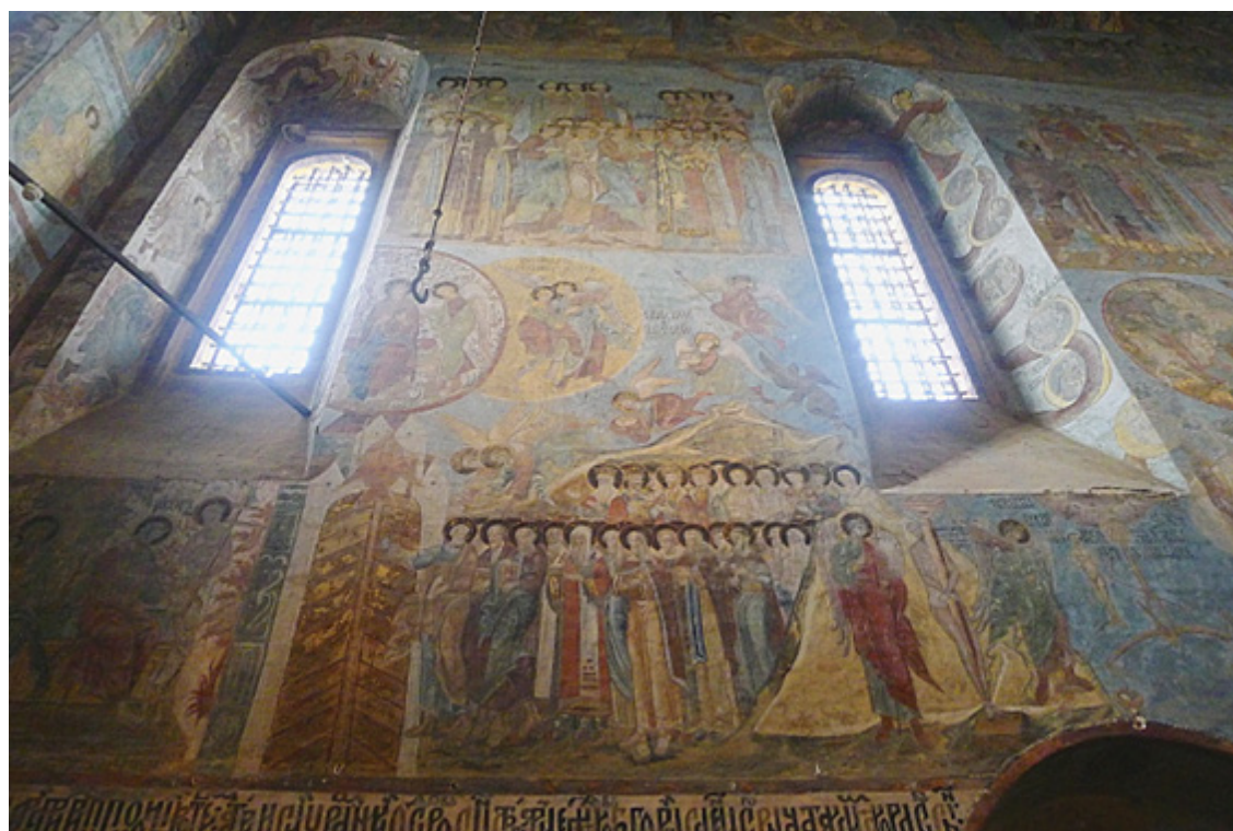
Рисунок 3 — Фреска «Страшный Суд» Благовещенского собора Сольвычегодска, нач. XVII в. Figure 3 — Fresco “The Last Judgment” of the Annunciation Cathedral in Solvychevodsk, early 17 th Century